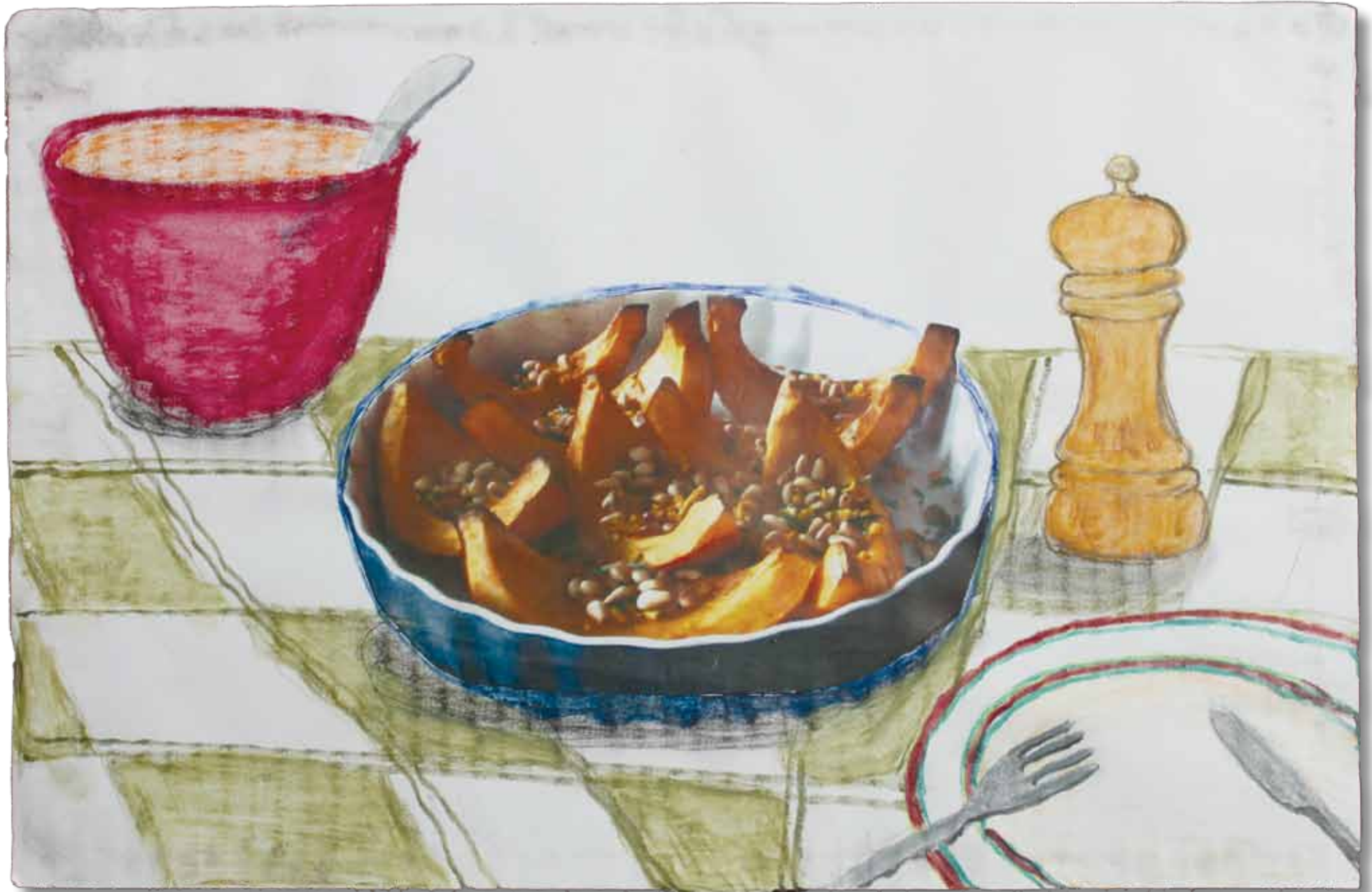
Mijn moeder houdt heel erg van koken en bakken. Bijvoorbeeld pompoen met zonnebloempitten. In de kom zit een heerlijke frisse tomatensalade.