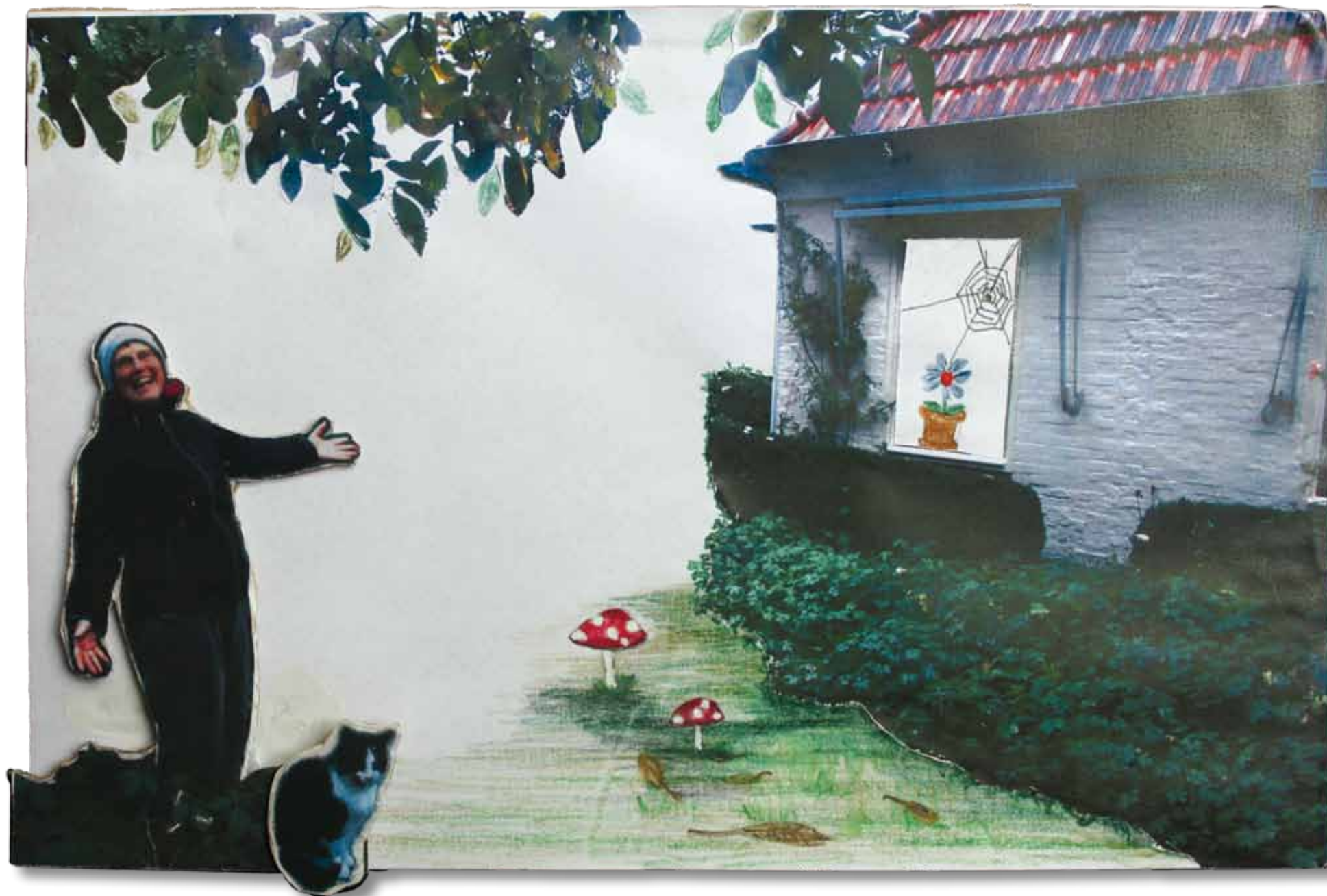
Mijn moeder woont heel ver weg in een klein wit huisje met kat Libel.