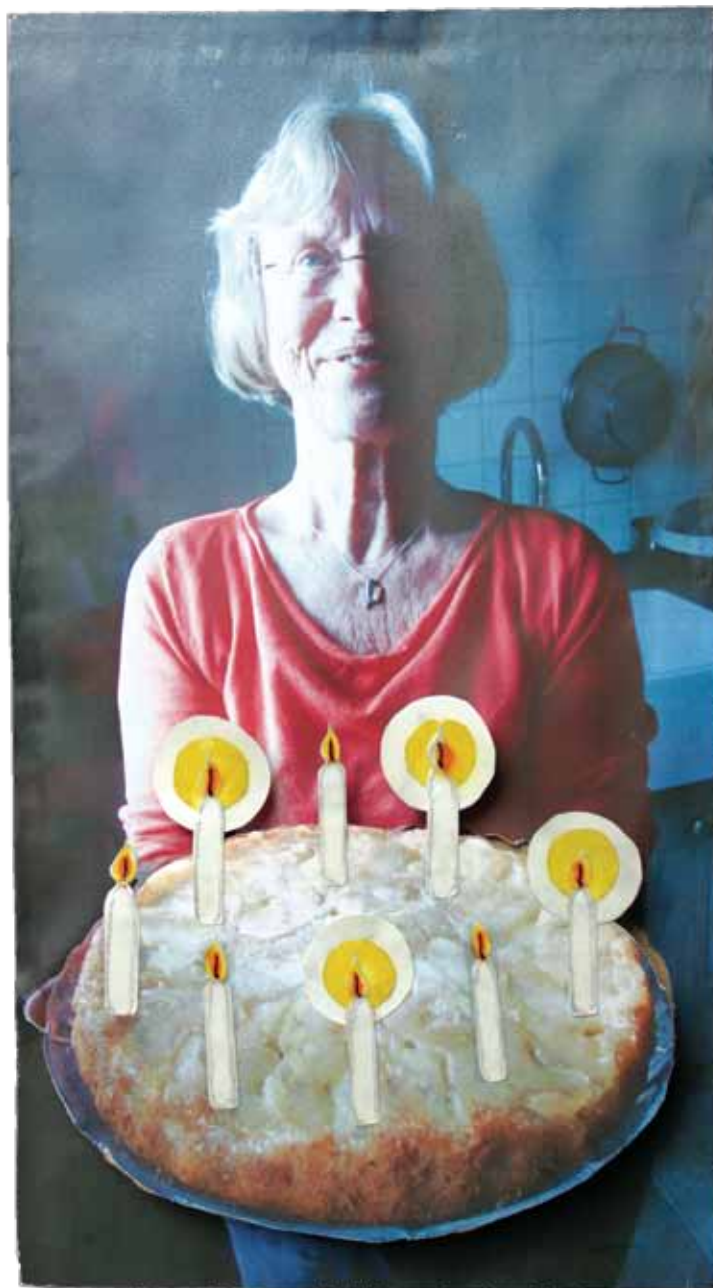
En kijk eens wat een lekkere taart. Met kaarsjes want ik was jarig.